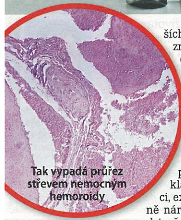
Tak vypadá průřez střevem nemocným hemoroidy

Také je třeba dávat pozor na správné dýchání při zvedání těžkých předmětů a při vyprazdňování na toaletě. Zadržování dechu totiž zvyšuje břišní tlak a to má na žíly negativní vliv. Na každého působí jiné faktory, které vedou k objevení příznaků hemoroidů, proto je dobré tyto faktory vytipovat a vyhýbat se jim. Může jít např. o konzumaci pikantních a ostrých jídel, alkoholické nápoje včetně vína a pěstování určitých sportů. ■