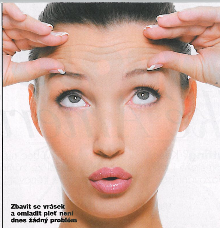
Zbavit se vrásek a omladit pleť není dnes žádný problém

Laserová operace pro vás vhodná je – buď metoda NeoLASIK, nebo NeoLASIK HD. Odstraní vám dioptrie do dálky a uvede vaše oči do stavu zdravého člověka ve vašem věku. Znamená to, že za pár let budete jako ostatní potřebovat brýle nablízko. Tomu se ovšem dá předejít tím, že se na jednom oku ponechá třeba 0,75 dioptrie krátkozrakosti, čímž se potřeba brýlí do blízka odsune ještě o dalších 7 až 10 let. Jiným řešením, které odstraní brýle do dálky a poskytne současně dobré vidění i do blízka, je implantace multifokální nitrooční čočky metodou PRELEX.